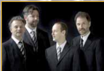
L'ENSEMBLE CAPILLA FLAMENCA

L'ensemble Capilla Flamenca , littéralement