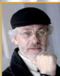
JAN WILLEM JANSEN

Jan Willem JANSEN , organiste concertiste de renommée internationale et directeur artistique du festival « Toulouse les Orgues » nous propose, avec l'ensemble Capilla Flamenca, un voyage dans la musique des Flandres des XV e et XVI e siècles.